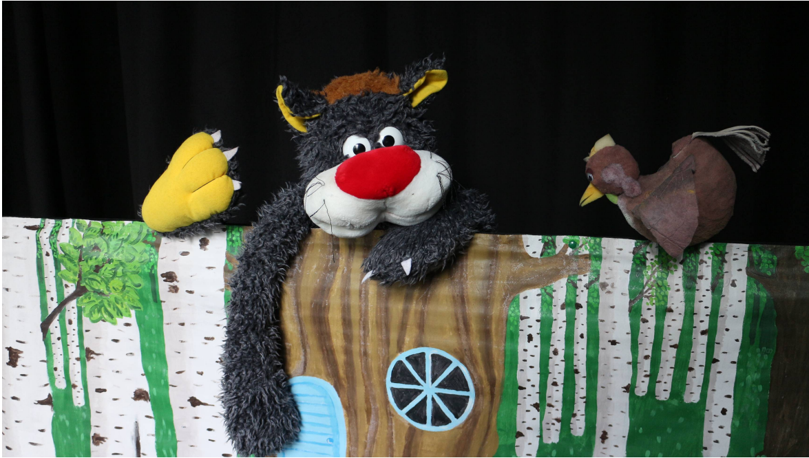
a puppet show for family audience, 3+