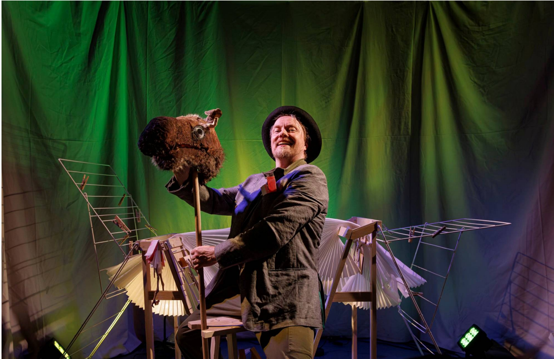
a puppet show for family audience, 4+

Liput / Biljetter : 10€ ( NetTicket.fi )