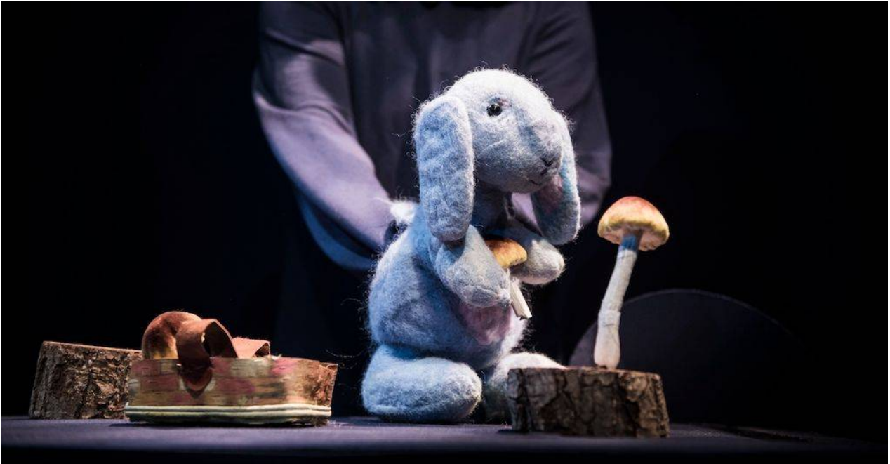
a puppet show for family audience, 2+

Kani Ja Ihmeellinen Pilvi Hellyttävän suloinen tarina kanista ja ihmeellisestä pilvestä. Kanilla on paljon mukavaa tekemistä ja makeisaa syötävää – mutta eräänä päivänä kania ei huvita enää mikään. Mikä kania vaivaa, tarvitaanko vähän taikaa? Margaret Wise Brownin kirjan innoittamana dramatisoidussa näytelmässä on suloisia pieniä eläinnukkeja, loruja, lauluja ja elävää musiikkia. Kaikenikäisille, etenkin perheen pienimmille!